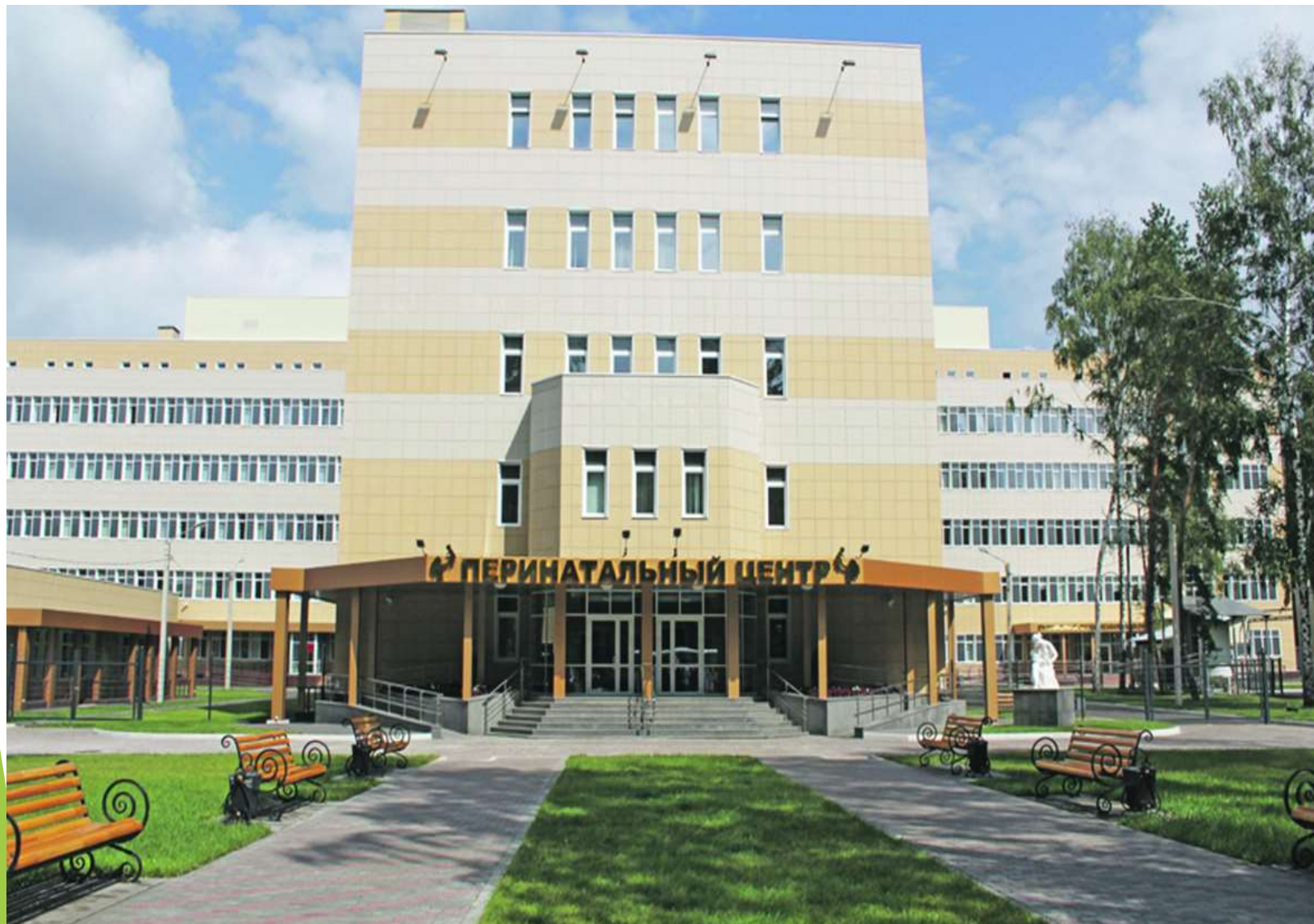
Воронежский медицинский генетический центр