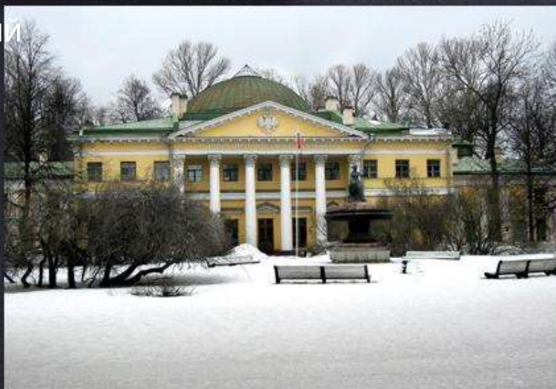
ВМА имени С.М. Кирова (1909-1913)