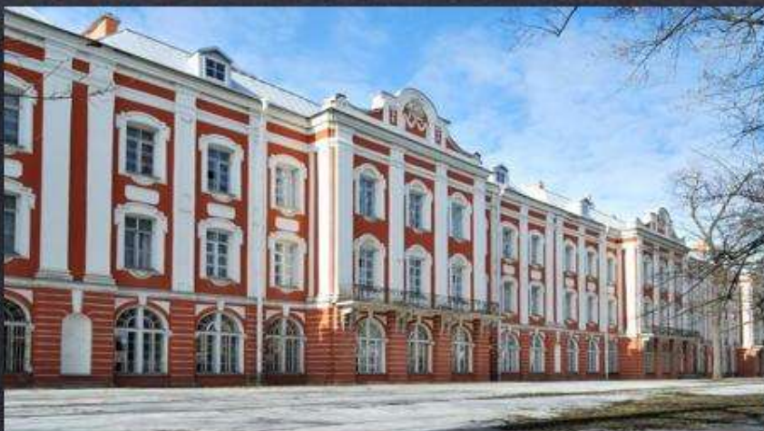
Санкт-Петербургский Университет (1907- 1909)