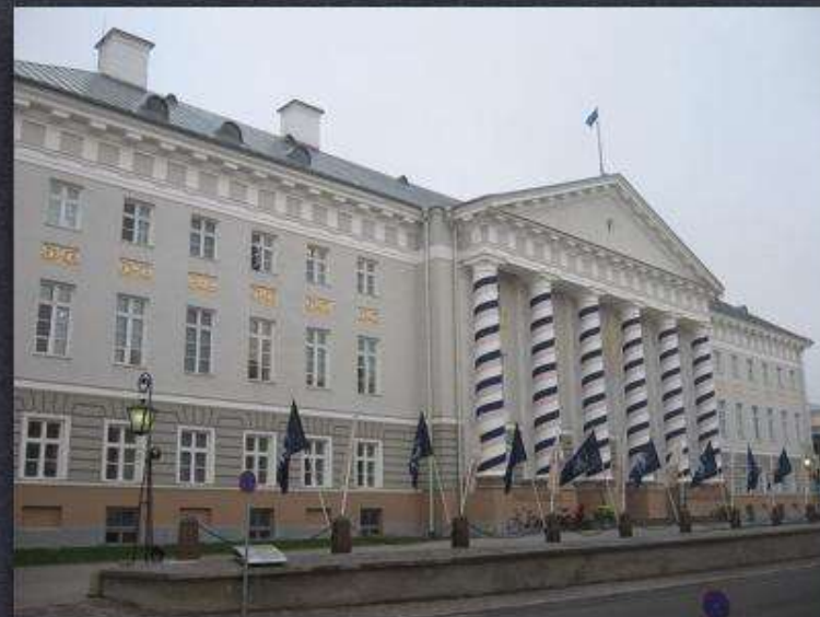
Юрьевский (ныне Тартуский) Университет (1913-1914)